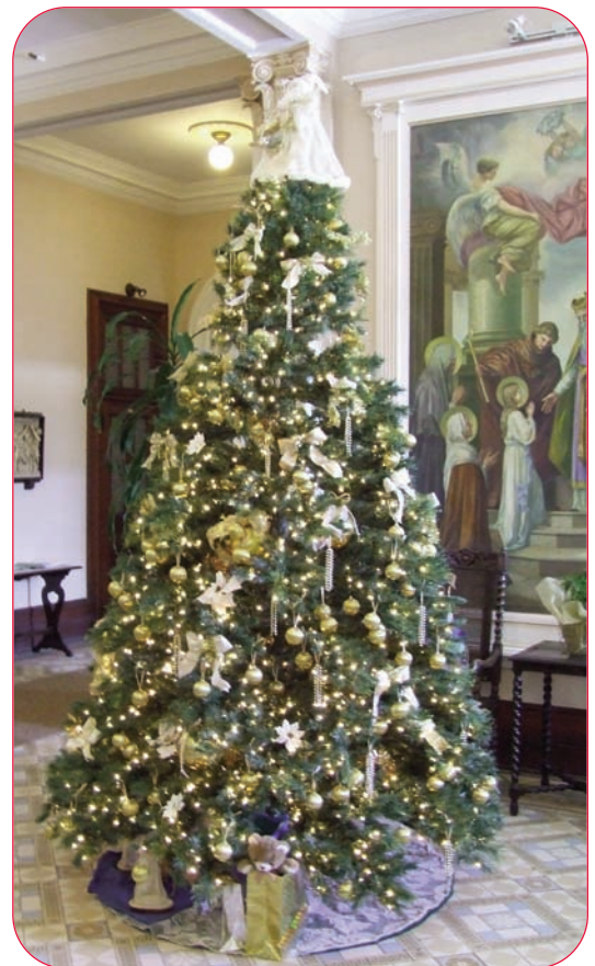
Sapin de la réception du PSNM

À chacun d'entre vous, nous vous offrons nos meilleurs vœux de paix, de santé et de bonheur pour cette période des Fêtes!